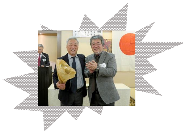
高杉会員 祝 お誕生日