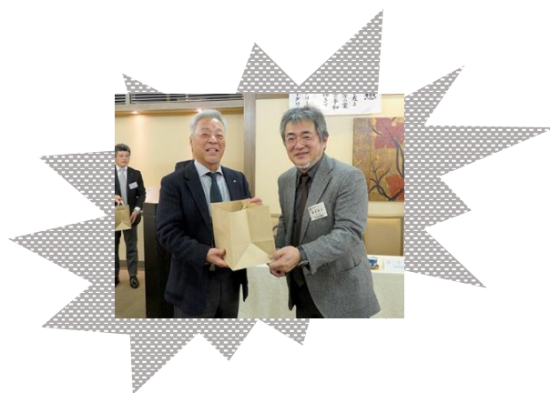
高杉会員 祝 結婚記念日 2月 3連単で登壇 おめでとうございます！！