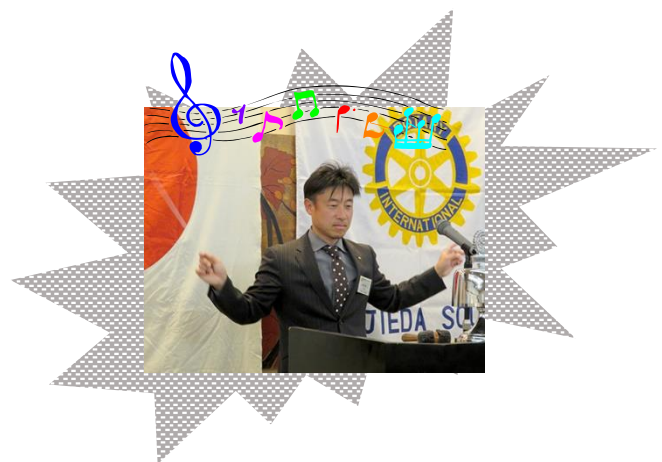
新ソングリーダー 出陣！ がんばれ～（笑）