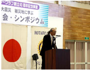
< 防災講演会・シンポジウム 藤枝市岡部体育館 >