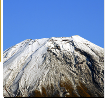
【 富士山 】

例会:毎週水曜日 小杉苑 藤枝市青木2-2-48 TEL 054-641-3321 事務局:藤枝市青木1-9-16 TEL 054-647-2300 FAX 054-647-2040 E-mail club1972@fujieda-rotary.org