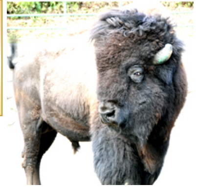
【日本平動物園にて】

2007-2008年度 RIテーマ ロータリーは 分かちあいの心 ウィルアリッドJ,ウィルキソソ