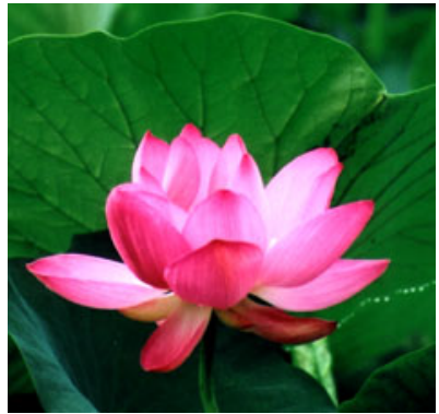
【 蓮華寺池の水蓮 】

会長 : 村松 英昭 副会長 : 青島 克郎 幹事 : 青島 彰 副幹事 : 仲田 廣志